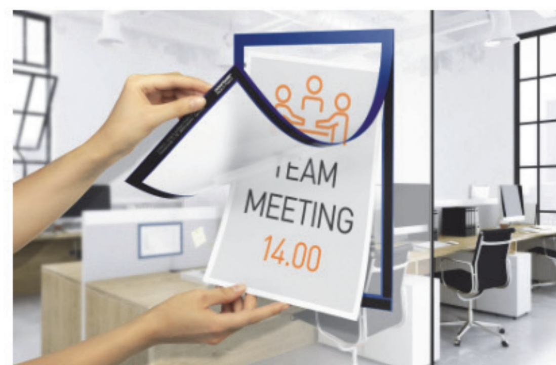
3. Helyezze be a dokumentumot