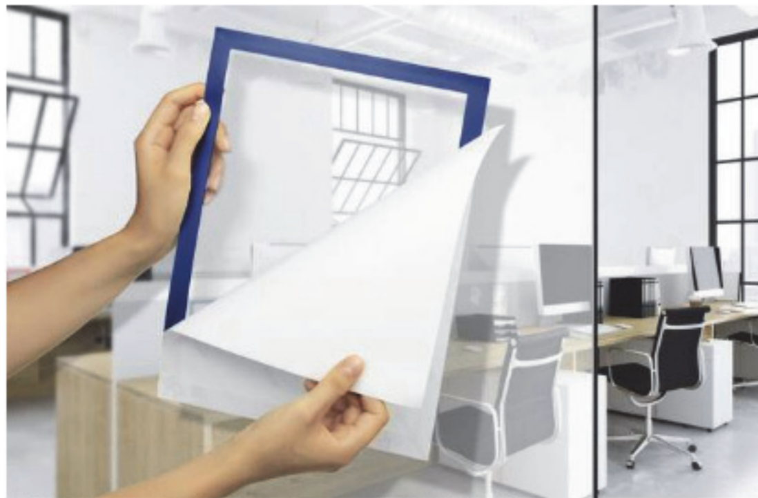
1. Távolítsa el a védőfóliát