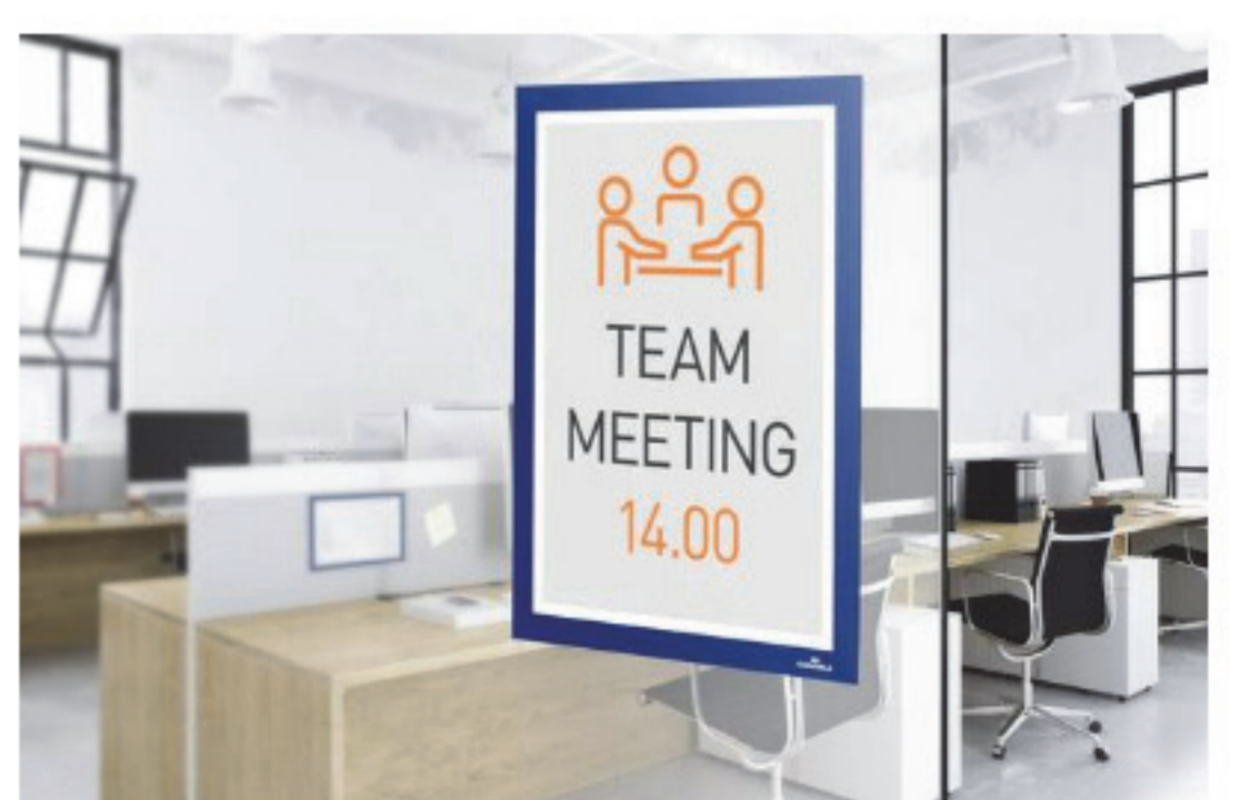
4. Cserélje az információt bármikor