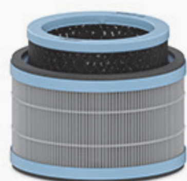
Allergia és influenza 3 az 1-ben szűrő