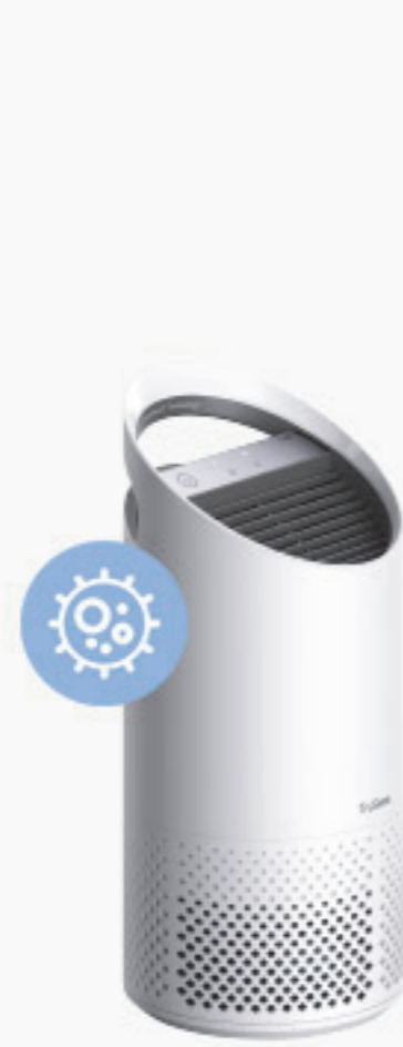
Leitz Trusens Z-1000