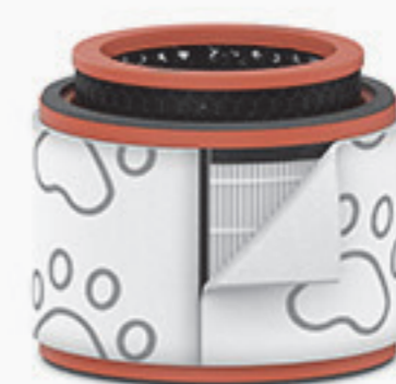
Háziállat 3 az 1-ben szűrő