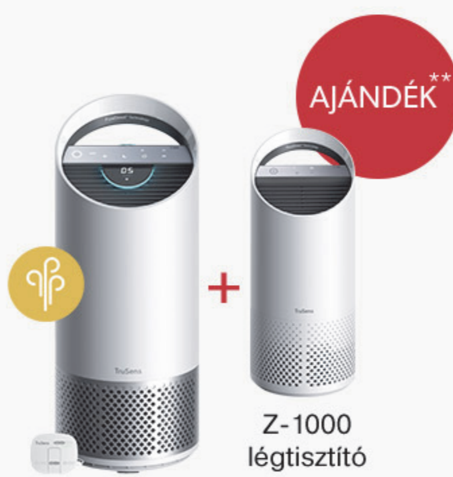
Leitz Trusens Z-2000