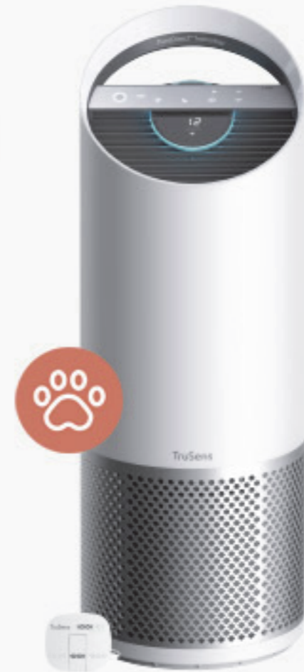
Leitz Trusens Z-3000